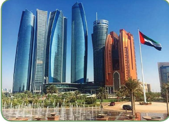
أبراج الاتحاد في أبوظبي

• العمارات متعدّدة الطوابق: وهي أكثر أنماط المساكن المنتشرة في الدّولة بشكلٍ كبيرٍ، حيثُ ارتبطَ ظهورها بمرحلة التّحوّل في البنية الاقتصاديّة للدّولة ومشروعات التّنمية.