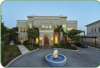
الفيلد الحديثة في دولة الإمارات