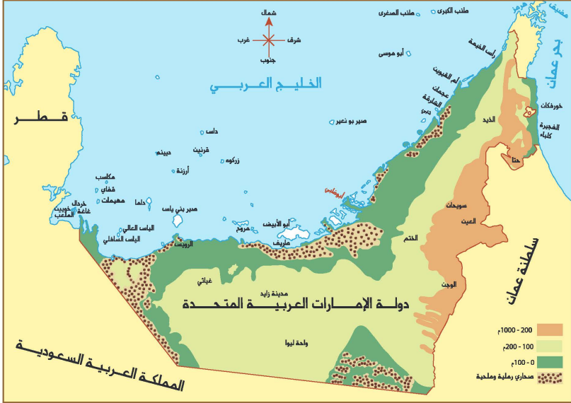
خريطة دولة الإمارات العربية المتَّحدة - مظاهر التسطح

النَّمط العامُّ لتوزيع المراكزِ الحضريَّة في دولة الإماراتِ العربيَّة المتَّحدة: تتوزَّع المراكزُ العمرانيَّة في الدَّولة على خمسةِ أقاليمٍ جغرافيَّة، تتفقُ إلى حدِّ كبيرٍ معَ أنواعِ التَّضاريسِ في الدَّولة، وذلكَ على التَّحوِّ الآتي: