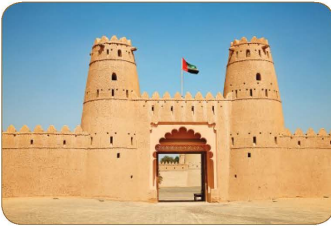
قلعة الجاهلي في مدينة العين

يَمْتدُّ الاستِقرارُ البَشَريُّ في دَولَةِ الإماراتِ العَرَبِيَّةِ المَتحَدَةِ إلى الألفِ الرَّابِعَةِ قَبْلَ المِيلادِ، بِناءً على ما أَكَدَّهُ التَّحْقِقاتُ الأَثَرِيَّةُ في مَنَاطِقَ مَختلِفةٍ في الدَولَةِ، إلا أَنَّهُ مَنَ المَرَجِّحُ أَنُ يَكونُ نَمطُ هذا الاستِقرارِ عِبارةً عَنَ مَجموعاتٍ صَغيرَةٍ مَنَ الأكواخِ مَصنوعَةٍ مَنَ سَعفِ النَّخيلِ، لِذَلِكَ لَمَ يَصمُدُ طَويلاً، أَمَّا التَّمَطُّ الثَّانِي فَهُوَ نَمطُ القِلاعِ الَّتِي انتَشَرتْ على طَولِ السَّاحِلِ وِبعضِ المَنَاطِقِ الدَّاخِليَّةِ كَقِلاعِ الجاهلي في مَدِينَةِ العَينِ وَالَّتِي بَقِيَتْ شَاهِدًا على الفِترَةِ التَّاريخِيَّةِ حَتَّى الآنَ.