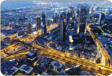
شبكة الطرق المطورة في دولة الإمارات العربية المتحدة

سهّلت وسائل النقل المتطورة نقل الأيدي العاملة من الريف إلى المدن؛ ممّا أدى إلى نموّ المدن واتساعها، وقد كانت شبكات السكك الحديدية والقطارات