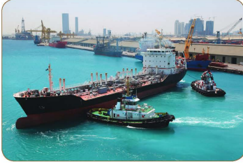
ميناء زايد لنقل البضائع

تزايد النشاط التجاري نتيجة تزايد الإنتاج الصناعي الذي لا بد من تسويقه بوسائل النقل المختلفة؛ لذلك لم تعد التجارة محصورةً داخلياً بل انتشرت عالمياً وأسهمت بظهور مدن الموانئ المتخصصة بتحميل البضائع المختلفة وتفريغها، فاحتاجت لمزيد من الأيدي العاملة للقيام بالإعمال المختلفة؛ مما أدى إلى زيادة ملحوظة في سكان المدن كما أسهمت وسائل التبريد المستخدمة في نقل المنتجات بين دول وقارات العالم المختلفة إلى زيادات إضافية في عدد السكان.